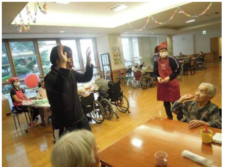
玄関で激しい戦いが行われている間に、各階にも子分の赤鬼が登場！皆さん頑張って追い払って下さいね！