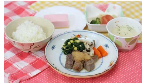
6月25日【誕生日会】 ごはん ステーキ ポタージュ 盛り合わせサラダ ケーキ