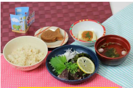
5月5日【こどもの日】 生姜ごはん カツオのたたき 豆腐田楽 すまし汁 鯛まんじゅう