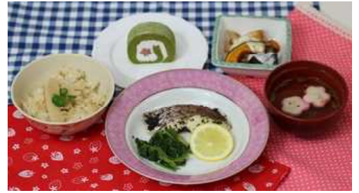
4月29日【昭和の日】 山城の筍ごはん 揚げ野菜のサラダ 鯛のハーフ焼 すまし汁 ロールケーキ