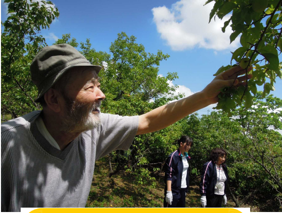
梅の実ゲット～！。とYさん☆

今月は梅の実狩りと手打ちうどんイベントがありました。 そして、外出レクでは高槻おんしん祭に行ってきました～♪