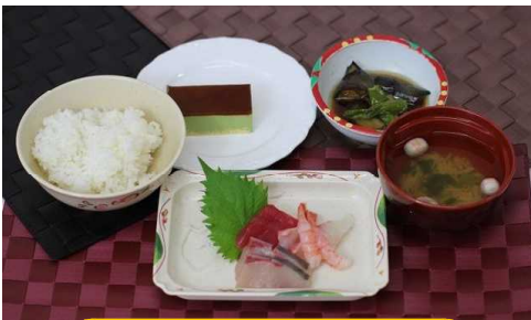
5月28日【誕生日会】 ごはん お刺身 お味噌汁 なすの揚げ浸し 抹茶ケーキ