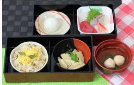
4月19日【誕生日会】 山菜ごはん お刺身 若竹煮 饅頭 吸物