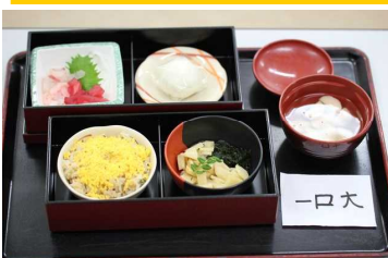
一口サイズに刻んでいます。