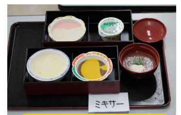
軟らかくて飲み込みやすい。