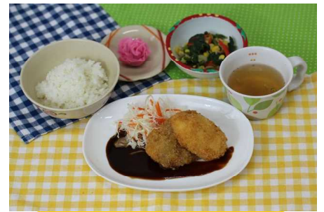
5月11日【母の日】 ごはん 手作りコロッケ オニオンスープ ほうれん草のサラダ 和菓子