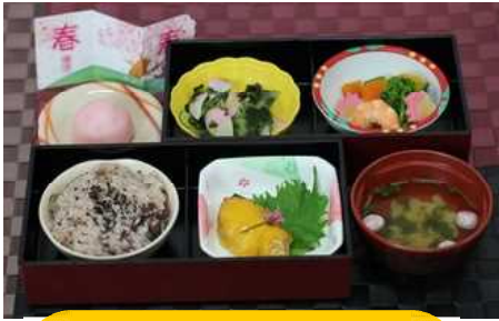
4月1日【運営記念日】 赤飯 さわらの黄身焼き 煮しめ 和え物 すまし汁 上用まんじゅう

施設では毎月、特別献立をご用意しています。 今回は日清医療食品さんが腕によりをかけて 作った特別献立をご紹介します d(^o^)b