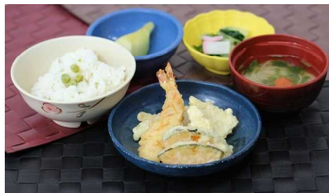
5月3日【憲法記念日】 豆ごはん 天ぷら盛り合わせ しろなのお浸し すまし汁 メロン