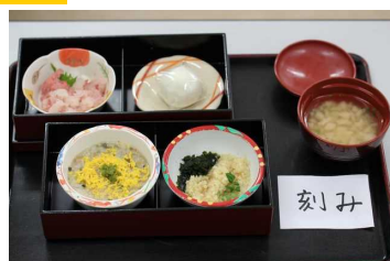
細かく刻んでいます。