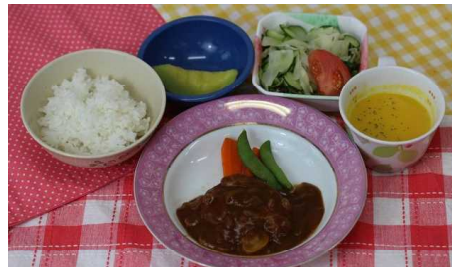
6月15日【父の日】 ごはん 手作りハンバーグ メロン フレッシュサラダ パンプキンスープ