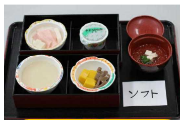
軟らかくて形状はそのまま。